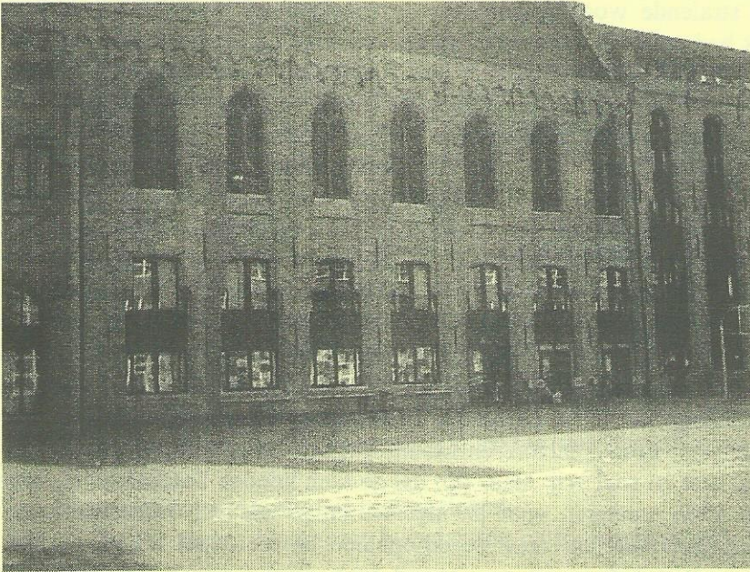
Het Leo College, onze verblijfplaats