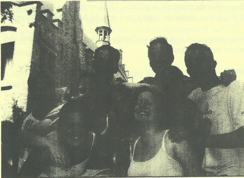
De jongste helft van het stel