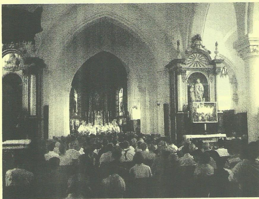
Verschillende koren lieten zich horen