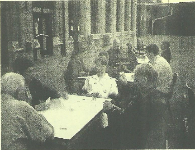
Donderdagavond, kaartavond: geslaagd voor jong en oud