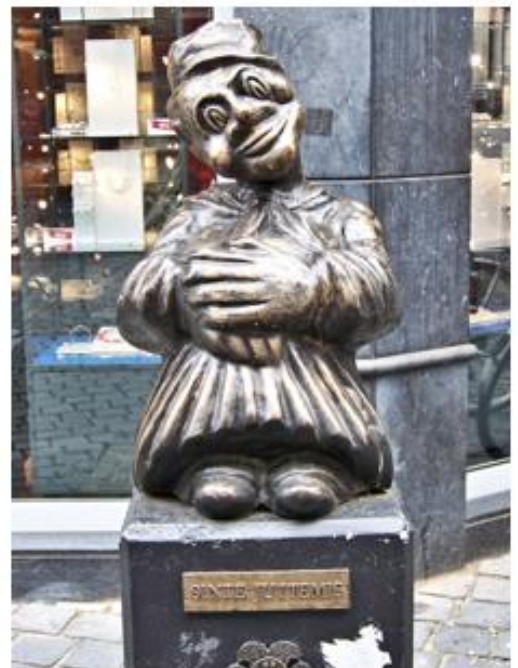
Beeld van Sint Juttemis in Breda