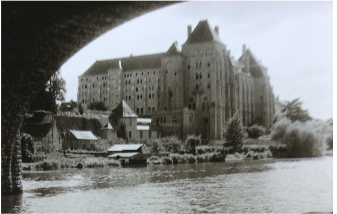
De abdij van Solesmes. Foto gemaakt in 1958 tijdens de reis met de verkenner.