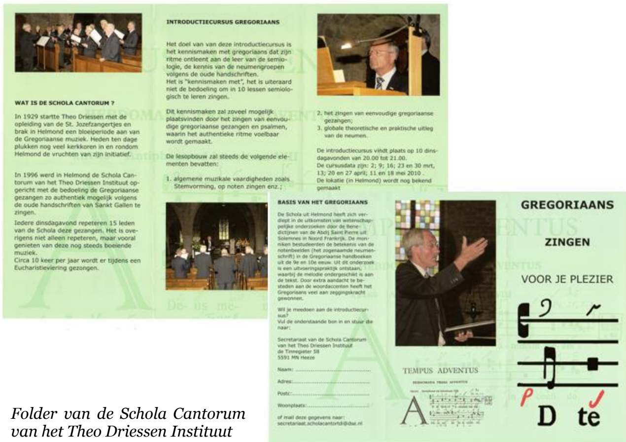
Folder van de Schola Cantorum van het Theo Driessen Instituut