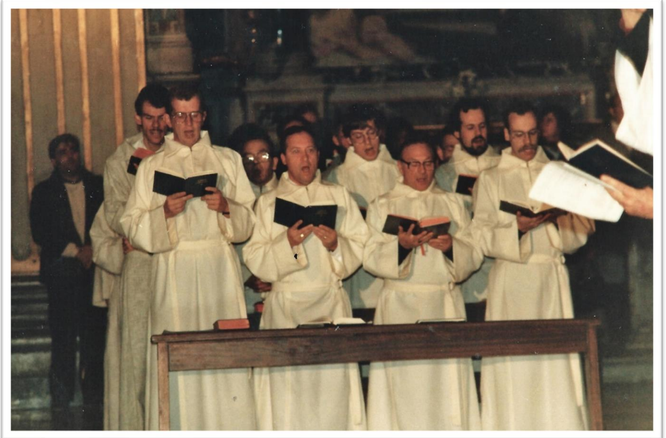
1985: Zingend in Rome tijdens het 8 e Conventus Internationalis Musicae Sacrae (2 e rij rechts)

Het absolute hoogtepunt voor mij is het “VIII Conventus Internationalis Musicae Sacrae”. Deze werd gehouden in Rome van 17 t/m 23 november 1985. Tijdens deze gelegenheid had het koor een ontmoeting met de toenmalige paus Johannes Paulus II.