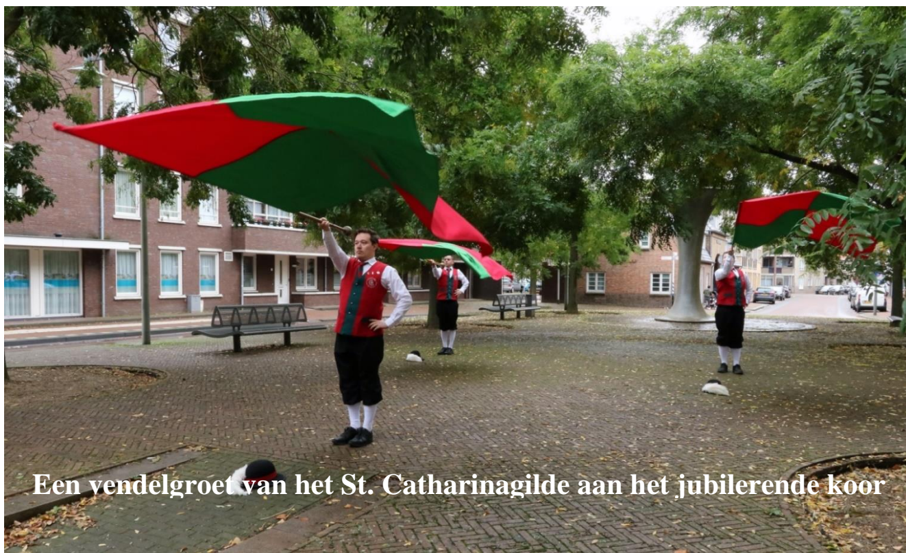
Een vandelgroet van het St. Catharinagilde aan het jubilerende koor