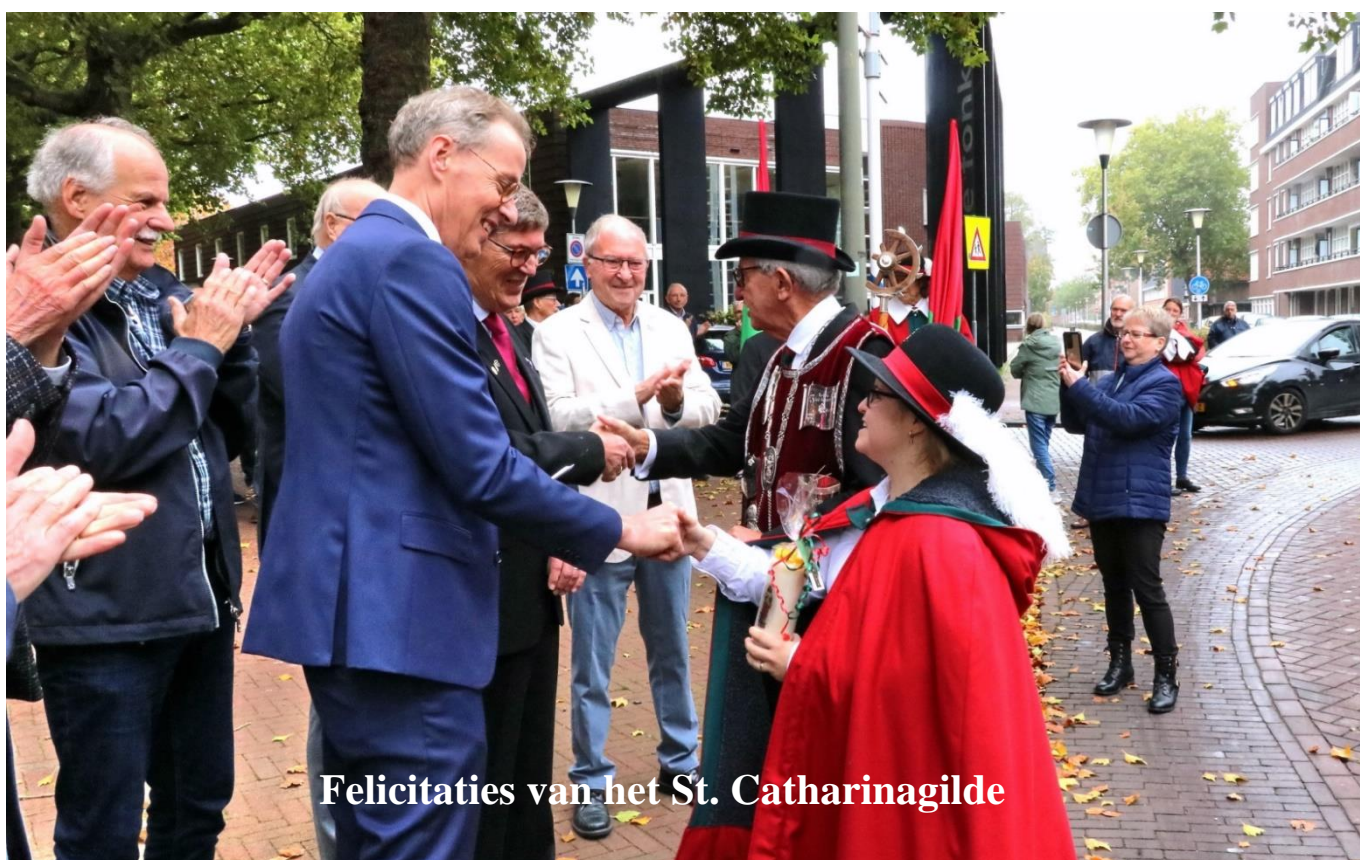
Felicities van het St. Catharinagilde