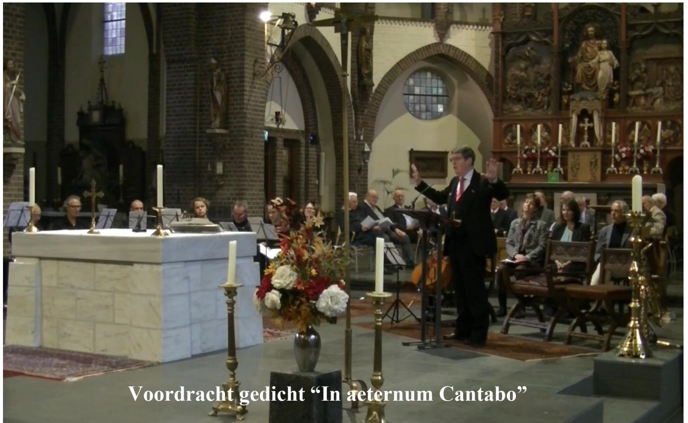
Voordracht gedicht "In aeternum Cantabo"