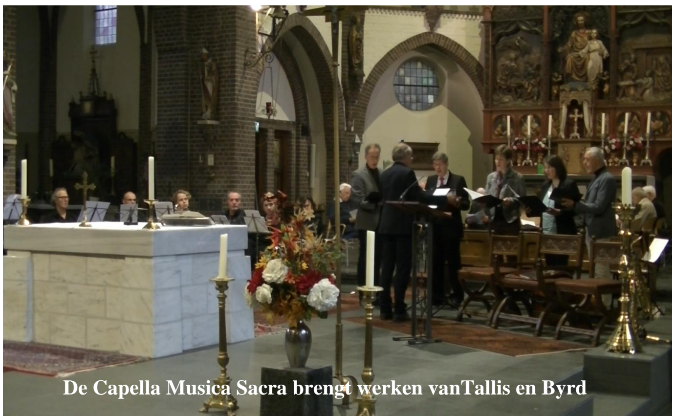
De Capella Musica Sacra brengt werken van Tallis en Byrd