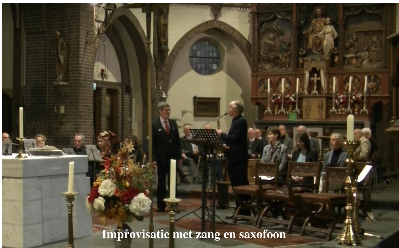
Improvisatie met zang en saxofoon