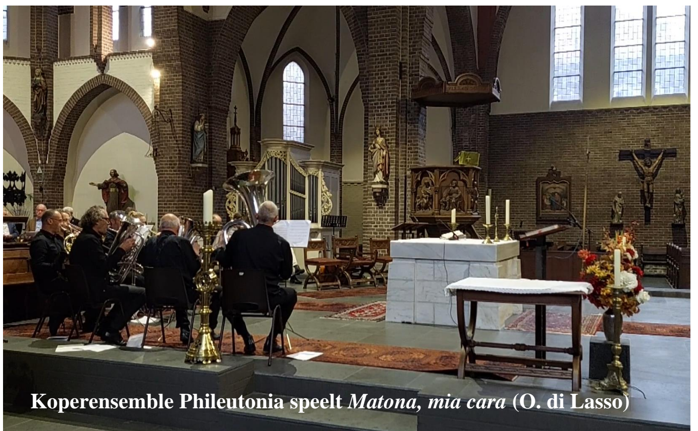
Koperensemble Phileutonia speelt Matona, mia cara (O. di Lasso)