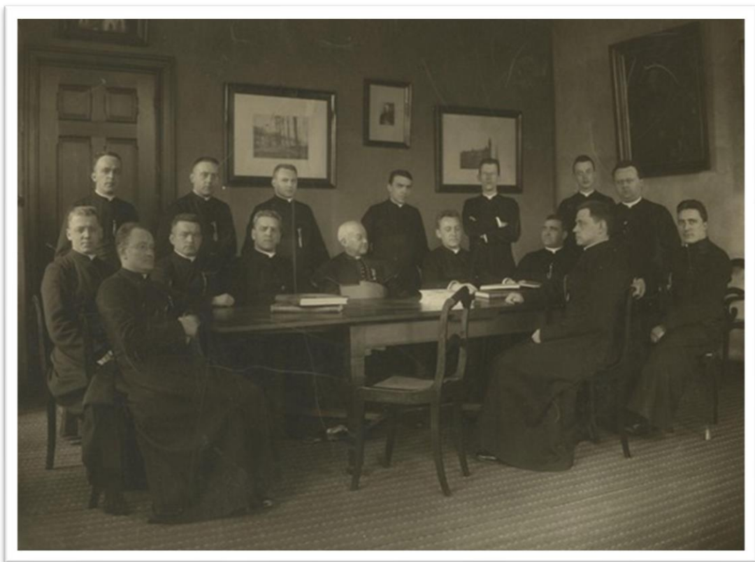
De 'professoren' van Beekvliet.