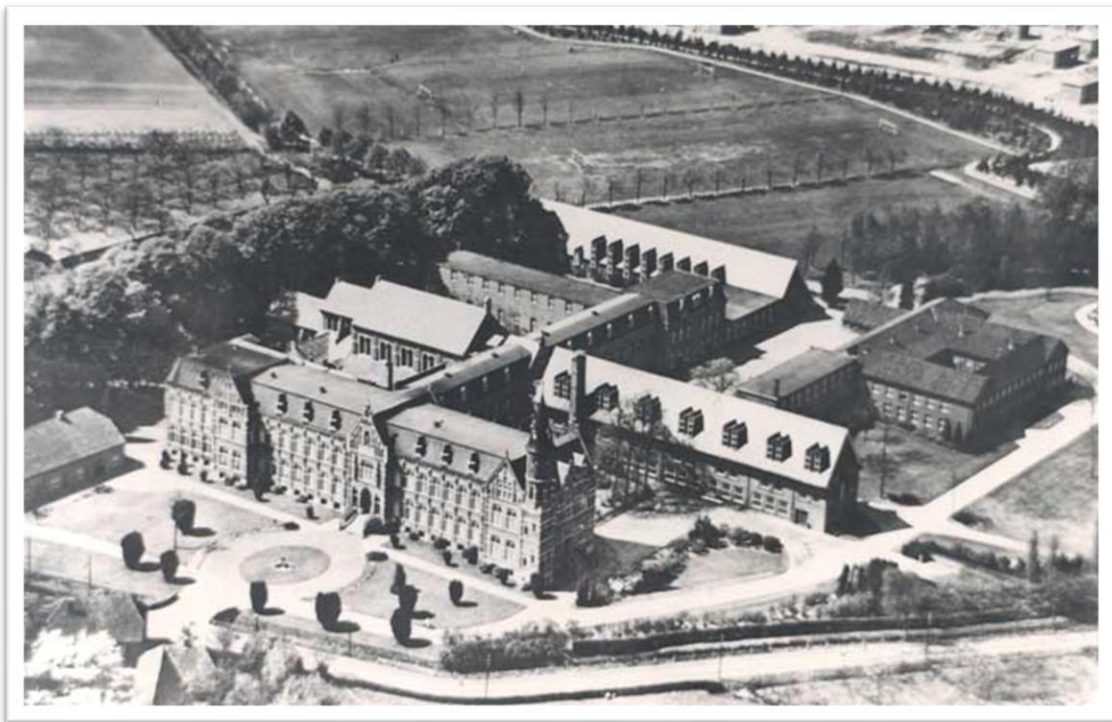
Seminarie Beekvliet, St. Michielsgestel.