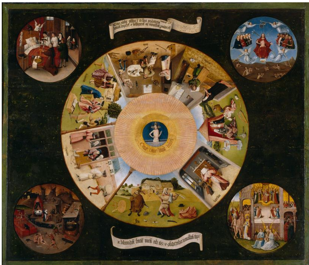
De zeven hoofdzonden; schilderij van Hieronymus Bosch (ca. 1510).