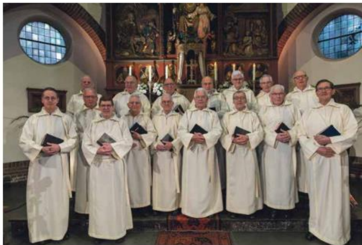
Het Sint Jozefkoor beschikt vanaf nu over een actuele website: www.sintjosefkoorhelmond.nl.