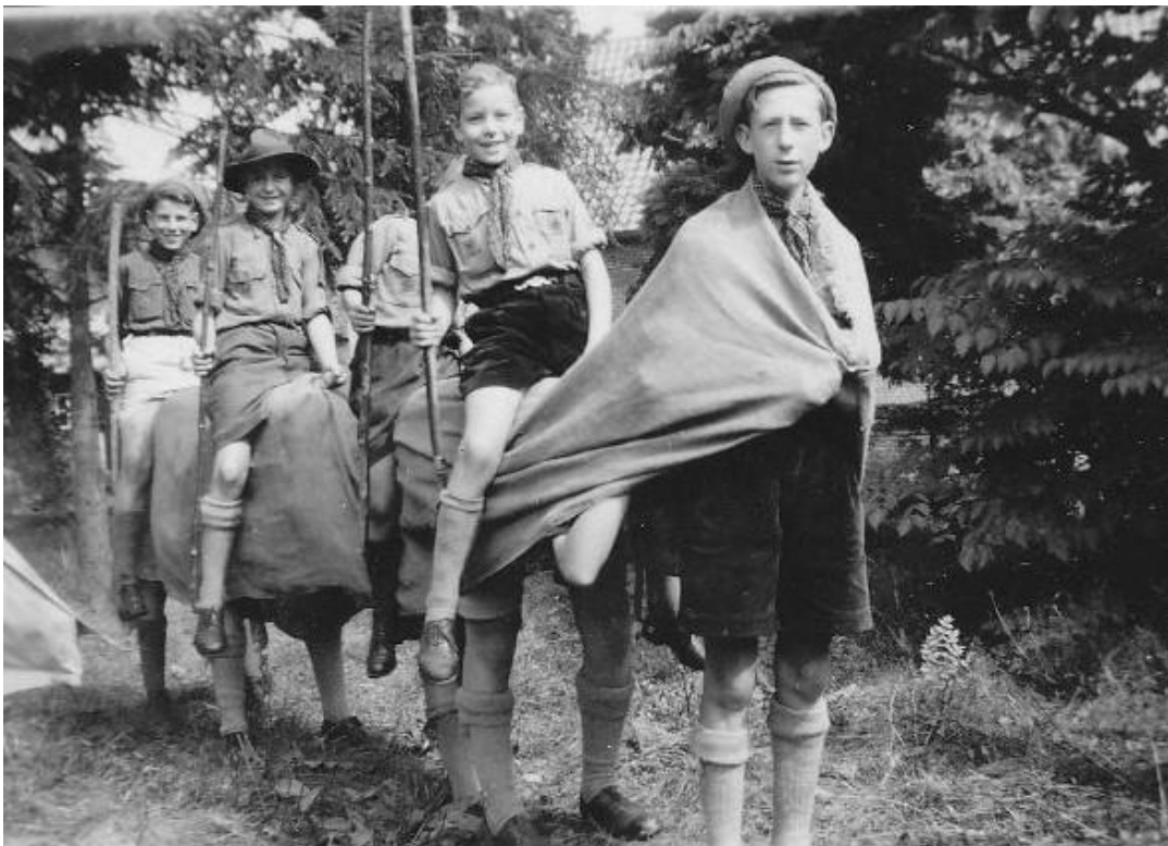
Als haantje de voorste op het "het paard" bij de verkenners