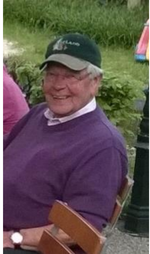
Op studiereis (Kevelaer 2016)