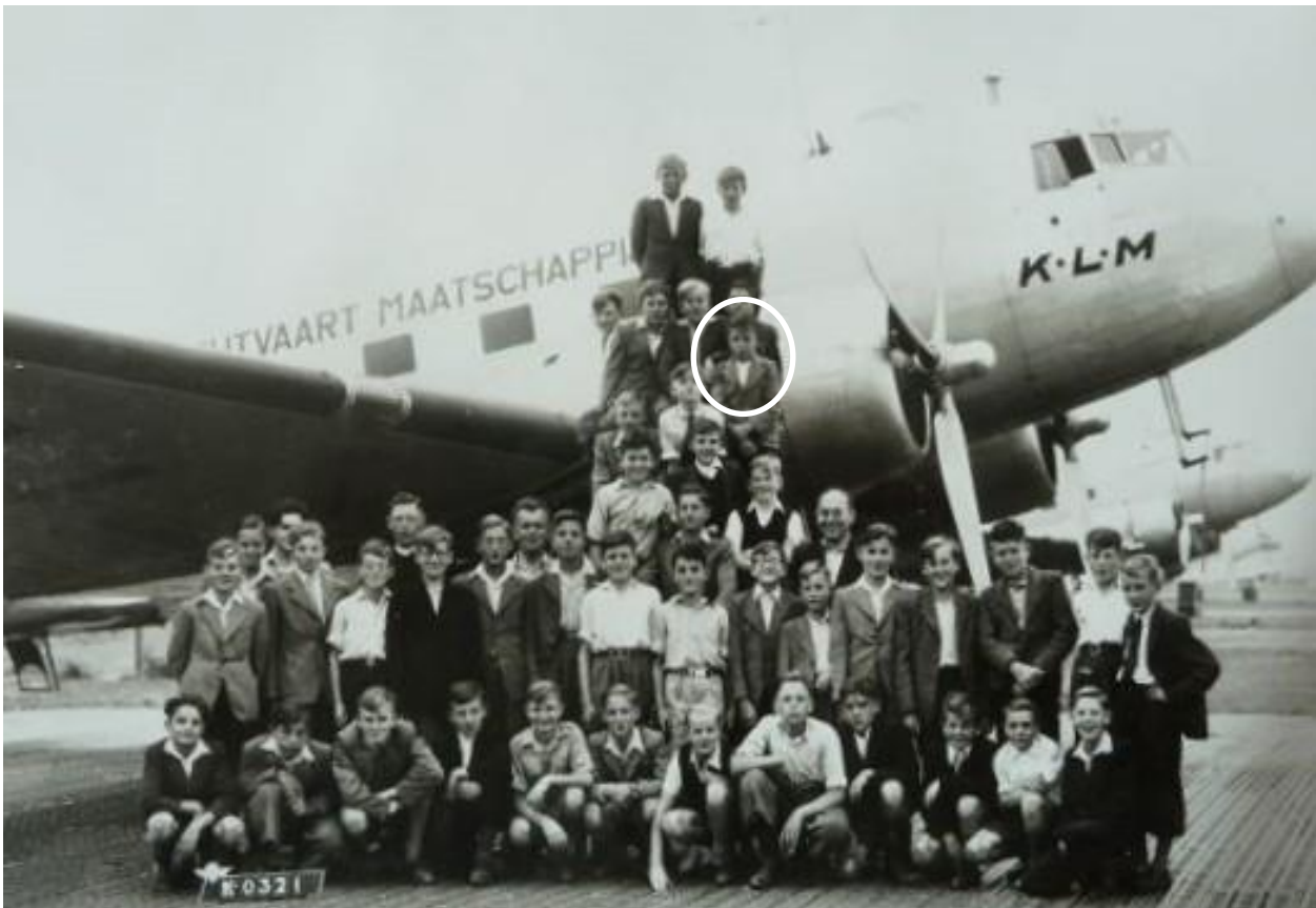
Uitstapje naar Schiphol eind jaren '40. Ik zit op de trap vlakbij de motor

Elk jaar vinden plezier- en educatieve reisjes plaats, soms meerdere in een jaar. Zoals naar Solesmes met lessen van de benedictijnen, een uitstapje naar Schiphol en naar de Sint Jan in Den Bosch. Traditioneel gebeurt dit laatste op het einde van het laatste schooljaar aan de St. Jozefschool. Aan een bezoek aan Mönchengladbach en Düsseldorf bewaar ik mooie herinneringen. Met 3 bussen gaan de St. Jozefzangertjes en het Sint Jozefkoor op weg naar Mönchengladbach om daar een mis te zingen. Na de mis gaan de St. Jozefzangertjes naar huis. Het Sint Jozefkoor reist door naar Düsseldorf om de opera "der Waffenschmid" van Lortzing bij te wonen.